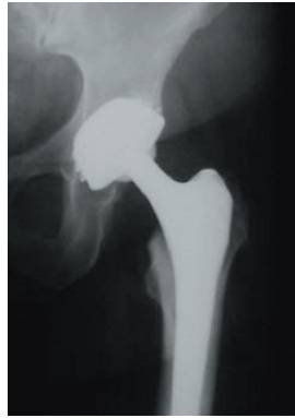
Zementfrei verankerte Hüftendoprothese