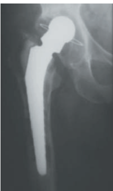
Lockerung einer Hüftprothese mit ausgedehnter Knochenzerstörung