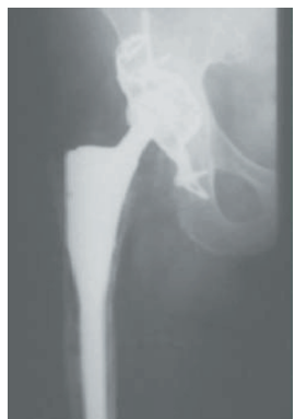
Wechsel auf eine Spezialprothese mit Knochenersatz