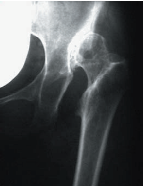
Angeborene Hüftgelenksverrenkung mit hochgradiger Beinverkürzung