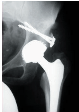
Beinlängenausgleich nach Einbau einer zementfreien Hüftprothese